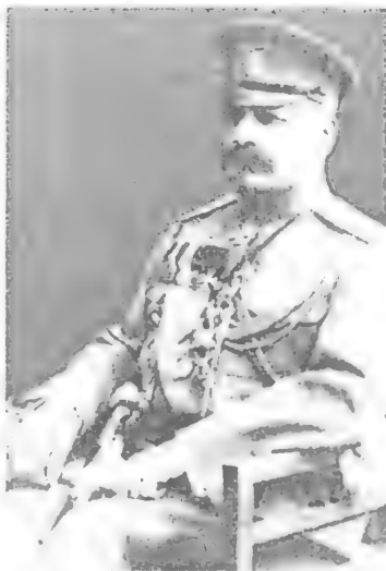
Гусейн-хан Калбали-хан оглы Нахичеванский (1863 – 1919)

В настоящей же статье мы расскажем о потомках Гусейн-хана Нахичеванского, эмигрировавших за границу. Гусейн-хан Нахичеванский родился в Санкт-Петербурге 28 июля 1863 г. в семье генерал-майора русской армии Калбали-хана Нахичеванского (умер в 1883 г.), сына последнего хана Нахичеванского – генерал-майора Эхсан-хана и его супруги Зари-ханым Макинской. Гусейн-хан получил образование в лучшем учебном заведении Российской империи – в Пажеском Его Императорского Величества корпусе, куда принимали только представителей высшего дворянства империи. После окончания Пажеского корпуса он был офицером лейб-гвардии Конного полка, где дослужился до чина полковника. Во время Русско-японской войны командовал 2-м Дагестанским кавалерийским полком и прославился своими рейдами в тыл японской армии. За Русско-японскую войну Гусейн-хан Нахичеванский был награжден орденом Св. Георгия 4-й ст. и был пожалован во флигель-адъютанты Свиты Его Императорского Величества. В период 1-й мировой войны Гусейн-хан командовал 2-й кавалерийской дивизией на Северо-Западном фронте. С октября 1914 г. по октябрь 1915 г. он командовал 2-м кавалерийским корпусом. С апреля 1916 г. по апрель 1917 г. – командир гвардейского кавалерийского корпуса – элиты русской армии, во главе которого участвовал в знаменитом Брусиловском прорыве на Юго-